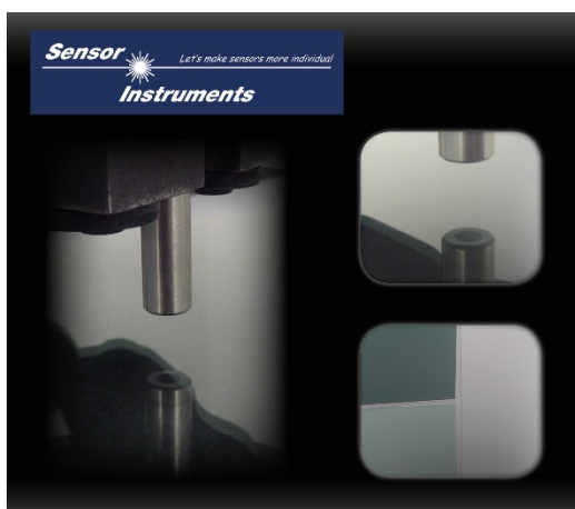
A parte dianteira da fibra óptica é direcionada perpendicularmente à respectiva superfície de vidro

A experiência mostrou que a superfície de vidro 'flotado' virada para o banho de estanho sustenta uma redução da reflexão óptica direta na gama de comprimento de onda UVC. Com a ajuda do sensor de contraste do tipo SPECTRO-1-FIO-UVC/UVC e uma fibra óptica reflexa em fibra de vidro de quartzo R-S-A3.0-(3.0)-600-22°-UV , o lado de estanho é facilmente distinguido pela reflexão de luz reduzida do lado do fogo, independentemente de ser de vidro 'flotado' de cor, fortemente colorido ou não colorido. A parte dianteira da fibra óptica é, assim, direcionada para uma distância de 5 mm perpendicularmente à respectiva superfície de vidro. Uma interferência externa de luz é evitada por meio de luz pulsada, assim como por respectivos filtros ópticos adequados. Devido ao método de medição sem contato, o sistema também é adequado para uso inline (em linha). Além disso, está disponível um alojamento de fibra óptica adequada para uso offline.