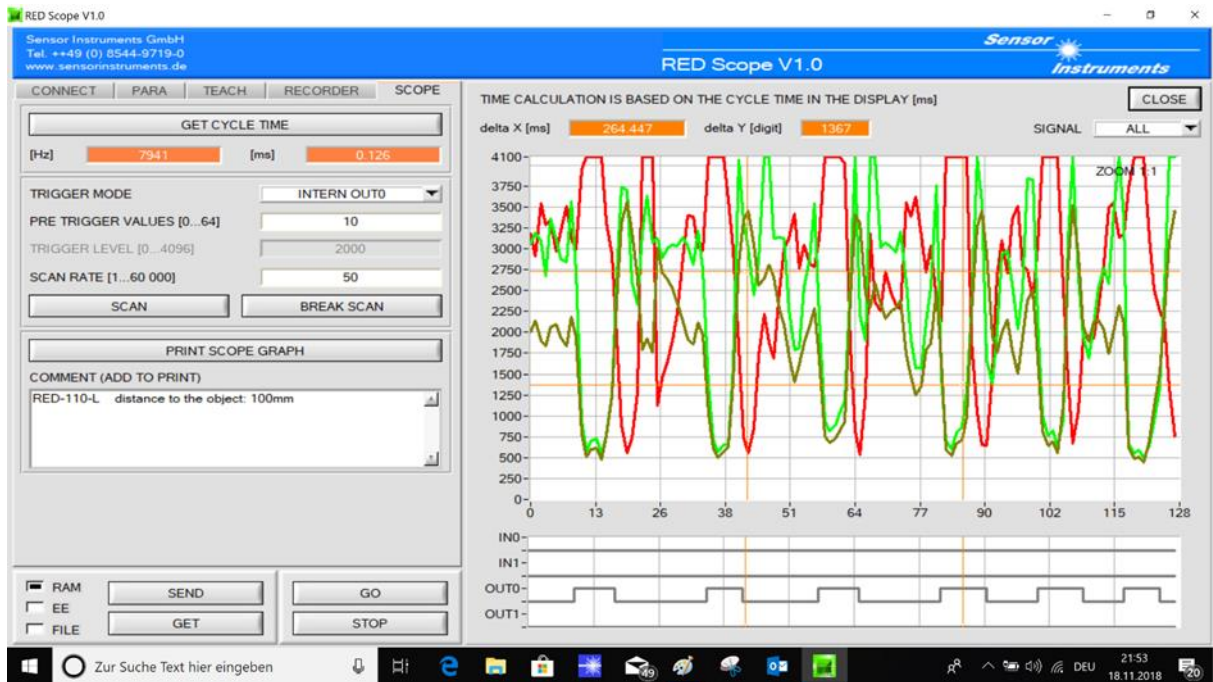
Signalauswertung des Kantendetektors RED-110-L mit Hilfe der Windows®-Software RED-Scope